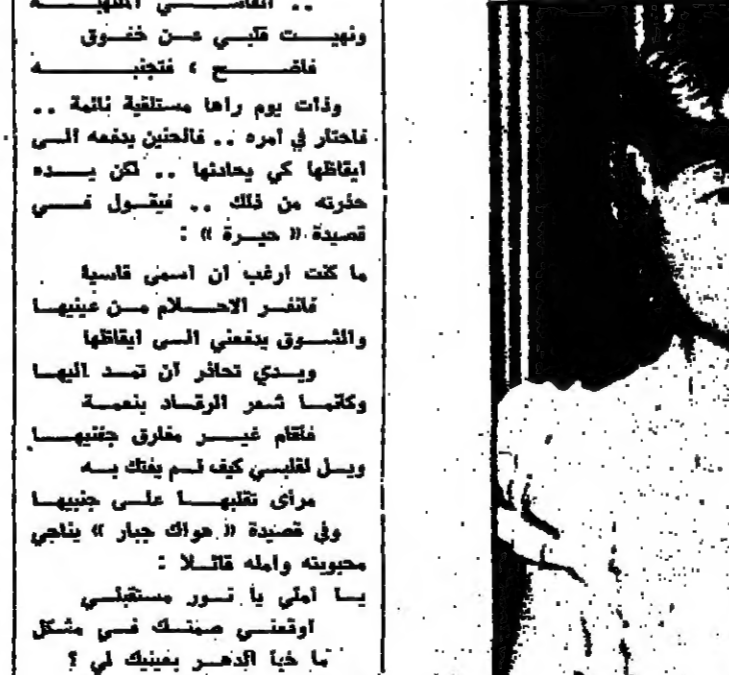
هذا من الاصل

يرتبط فلك بالعلم الحديث الذي يدرس حركة النجوم والكواكب في الفضاء . فلك علم يدرس حركة النجوم والكواكب في الفضاء . فلك علم يدرس حركة النجوم والكواكب في الفضاء .